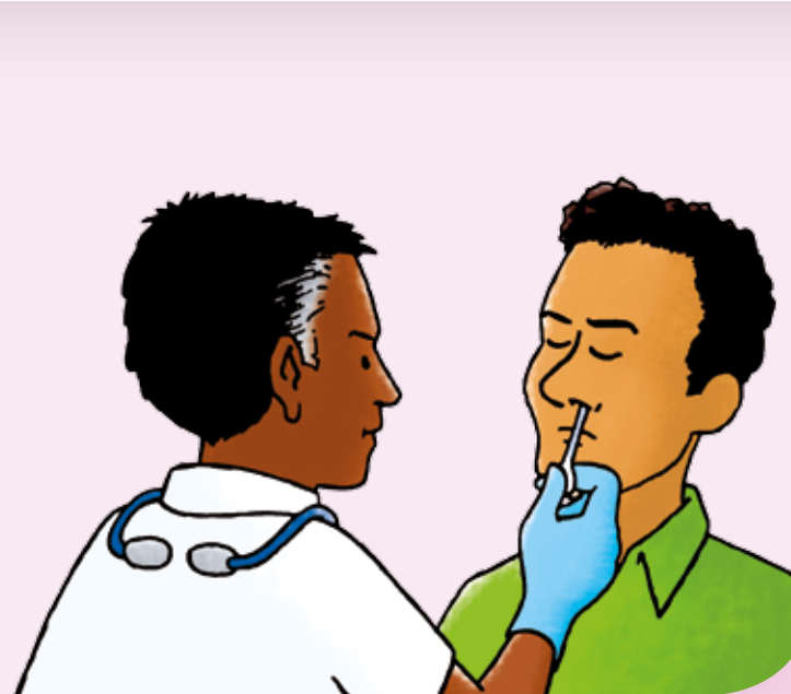
handschoenen, schort, masker, muts